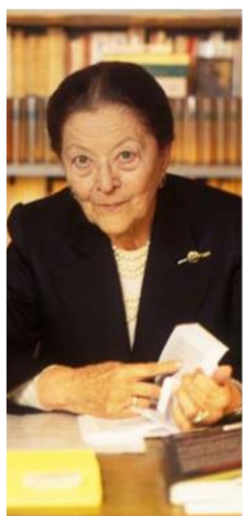
La romancière avait consacré plusieurs ouvrages à l'évocation de grandes figures féminines comme Coco Chanel ou Isabelle Eberhardt.

Son œuvre, bien qu'honorable, ne restera peut-être pas sa principale contribution à la vie littéraire. Sa personnalité de femme libre, quels qu'aient été ses liens avec un homme politique qui a marqué son époque, surtout à Marseille, semble plus importante. Et ce sont ces qualités-là qui lui ont permis, au sein de l'académie Goncourt, de donner un coup de jeune à celle-ci. Elle n'est pas pour rien dans l'existence du Goncourt des Lycéens en 1988, alors qu'elle n'était arrivée que depuis cinq ans. Et, sous sa présidence, les statuts de la société plus que centenaire ont été singulièrement rajeunis, quoi